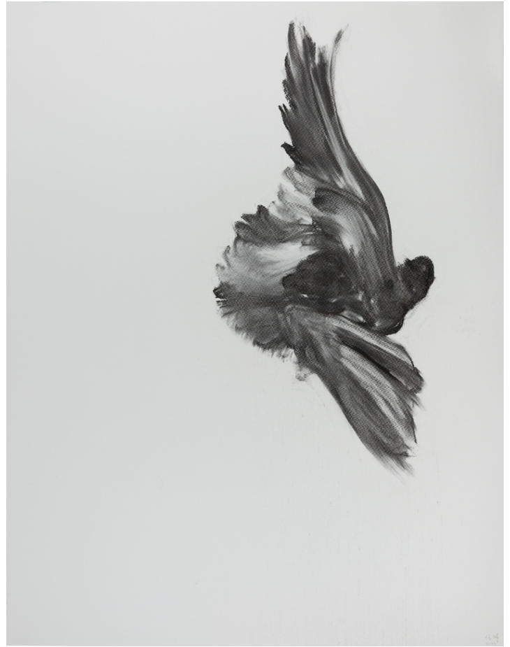
STUDY OF ROLLER PIGEON fusain sur papier, 2022 65 x 50 cm

Enfin, à l'étage du Nouvel Institut Franco-Chinois, une série d'études réalisées au crayon à papier sur fond blanc, de pigeons volant sur les murs bleus.