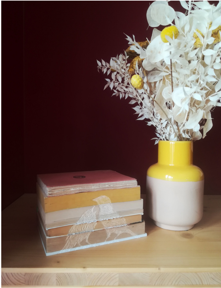
UNTITLED (20F01) (OISEAU 013) gravure sur livres anciens, 2020